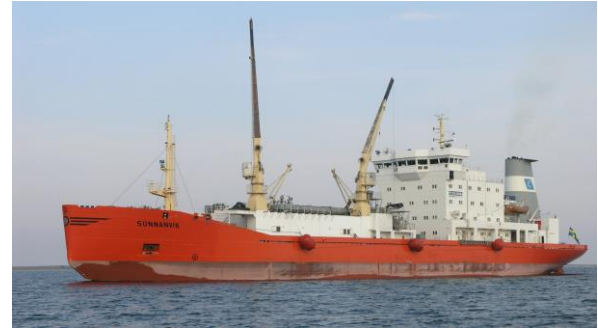
4 augusti 2005

Museet förvaltar några ankare av olika typer. Det tyngsta av dem är det som visas på bilden. Det väger 4060 kilo och kommer från Cementas 124 meter långa fraktfartyg Sunnanvik , byggt i Hamburg 1978.